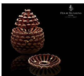
Maxime Frédéric George V - Paris

Créée par des ingénieurs en aéronautique en 2017, la start-up Mokaya mêle les technologies de design et d'impression 3D au savoir-faire des pâtissiers. La société crée des moules de pâtisserie ultra-personnalisés et d'exception. Près de 150 chefs dont 30 parmi les plus grands noms, comme Pierre Hermé, Cédric Grolet et Michaël Bartocetti ont, depuis sa création, sollicité la start-up pour libérer leur créativité ; les possibilités offertes par la 3D étant quasi illimitées.