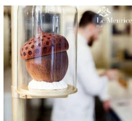
Cédric Grolet Le Meurice - France