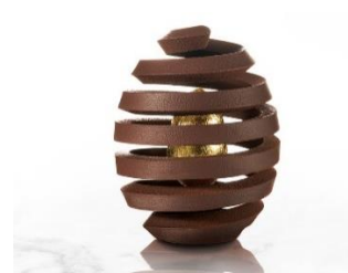
Florent Margailan Grand-Hôtel - Cap Ferret

Cette acquisition s'inscrit dans la démarche d'innovation constante du Groupe qui, depuis 50 ans, conçoit et développe, au travers de ses marques Flexipan, Sasa et Silpat, des supports de cuisson répondant aux besoins pointus des professionnels et industriels mais aussi des consommateurs experts et passionnés. Chaque année, les équipes R&D du groupe initient et déploient plus de 100 projets de prototypage. Avec Mokaya, Sasa Demarle ajoute l'expertise en conception 3D à son savoir-faire industriel pour en développer tout le potentiel dans les années à venir et accélérer son time to market en le divisant par 3 : un avantage de taille sur le marché ultra-dynamique de la pâtisserie.